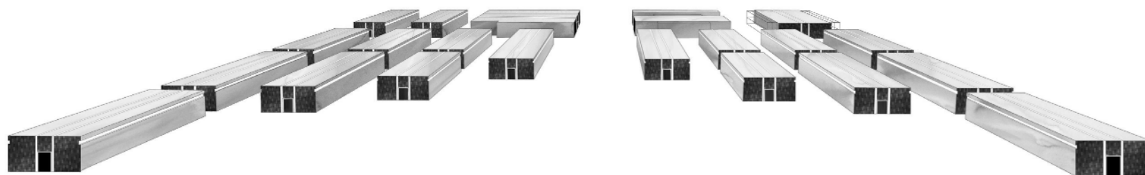
Forvaringscenteret set fra sydøst